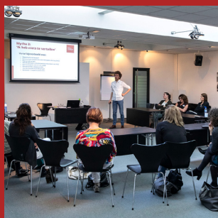
Presentaties IGJ, Surplus, Waarde-vol onderwijs, Communicatie