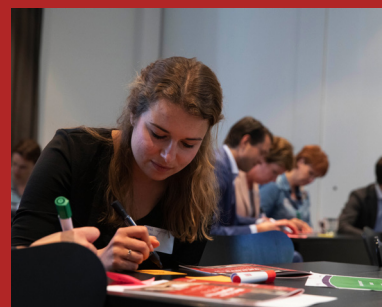
Tips schrapsessie regeldruk