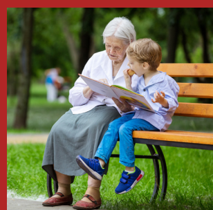
Methodiek Betekenisvolle rollen