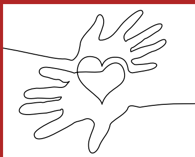
Elkaar versterkende behandeldiensten en zorgteams