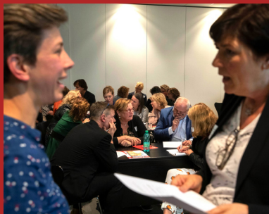
Ook bestuurlijk leiderschap op de schop