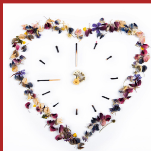
Van aangestuurde naar samenverantwoordelijke teams voor welzijn