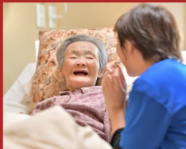
Methode Beelden van Kwaliteit